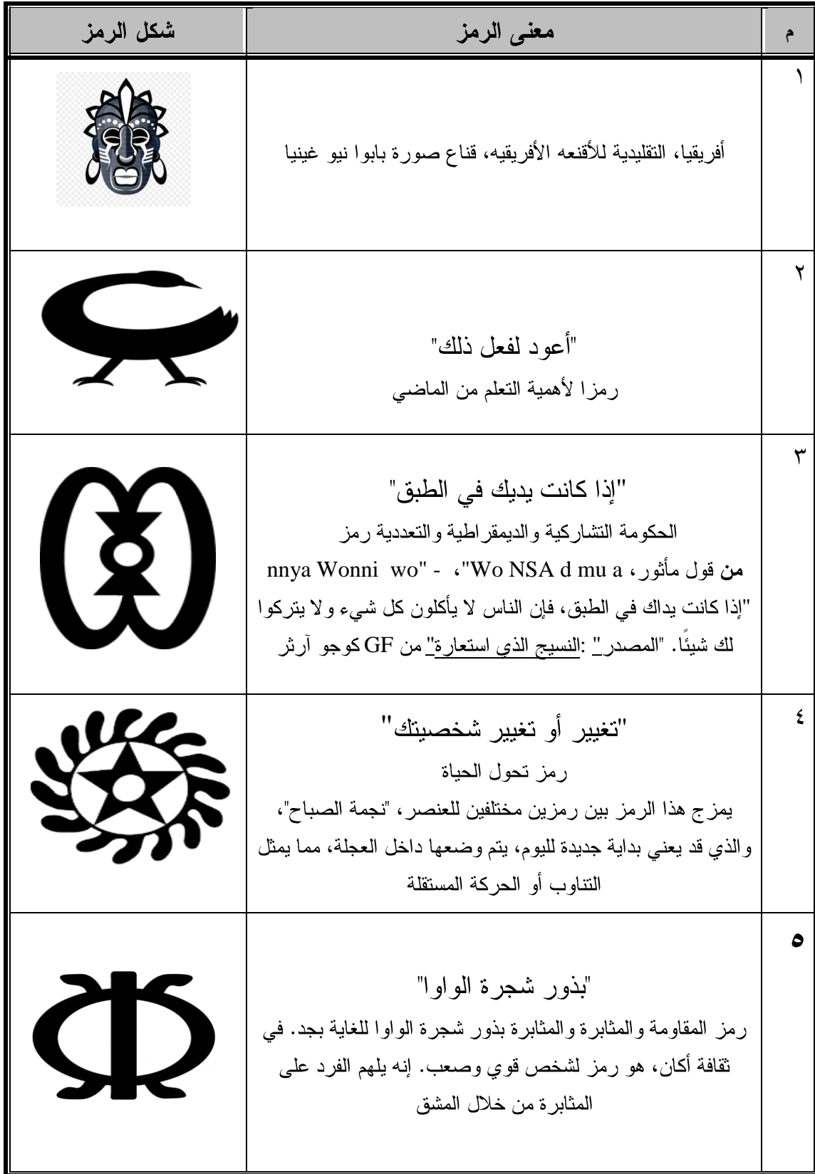
جدول (١) توضيح لبعض الرموز الإفريقيه ودلالاتها