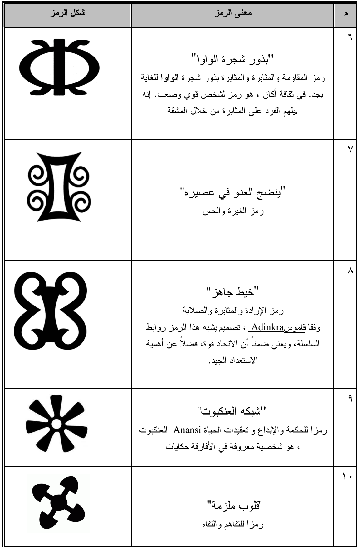
تابع جدول (١) توضيح لبعض الرموز الإفريقيه ودلالاتها