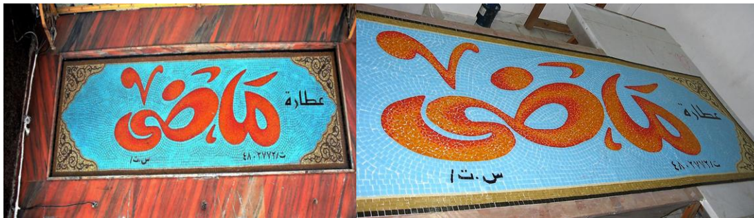
مراحل العمل في الرسم (١٠)