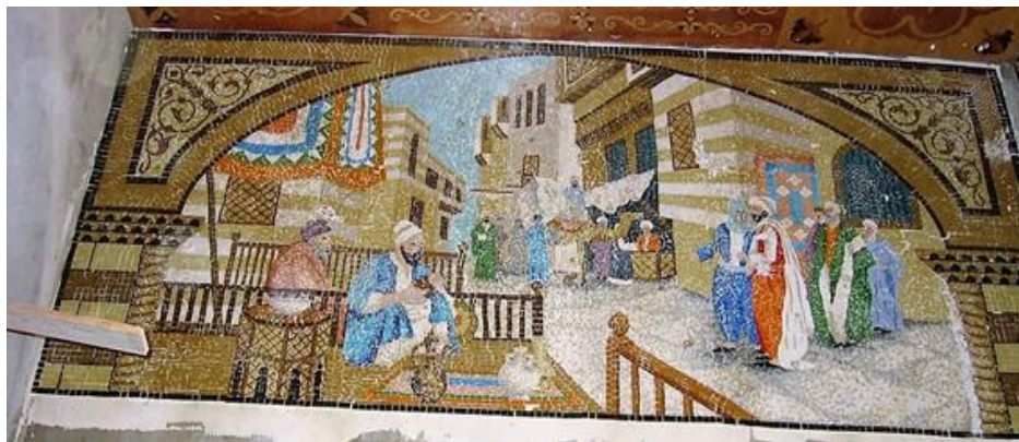
اتناء التركيب في الموقع (٣)