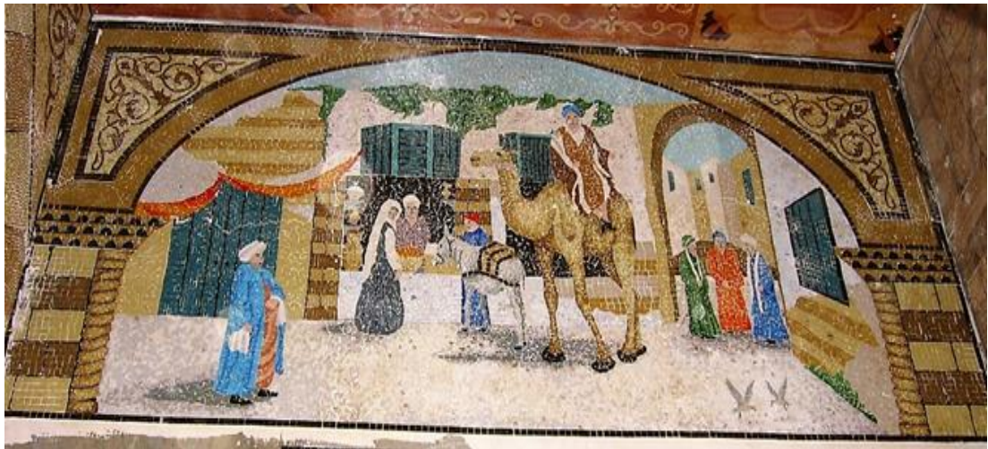
اثناء التركيب في الموقع (٢)