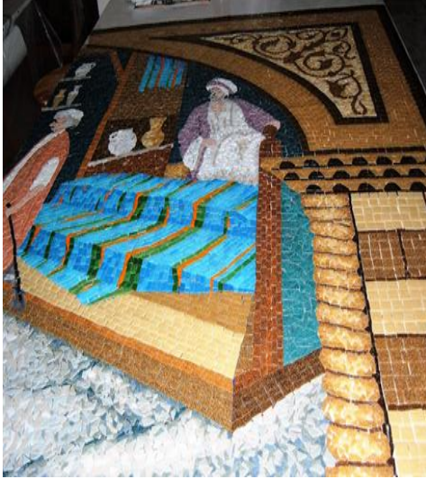
مراحل العمل (٥)