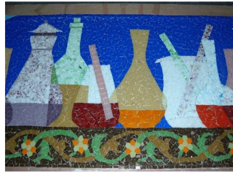
مراحل العمل (٩)