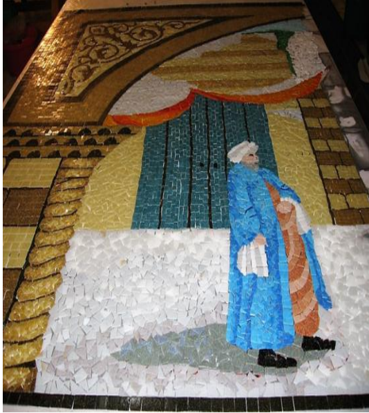
مراحل العمل (٢)