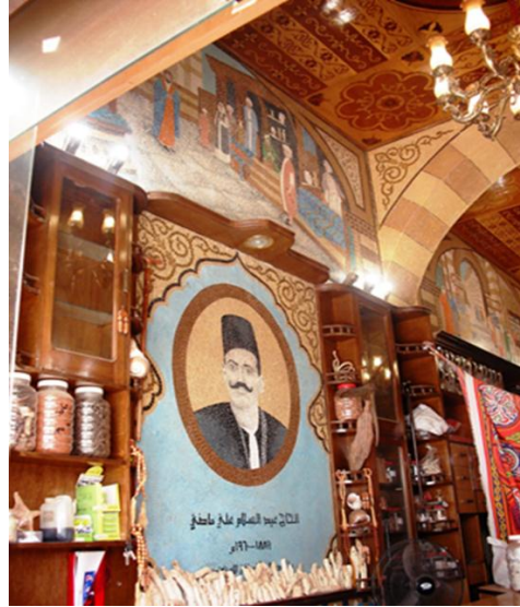
في الموقع عمل رقم (٤) و(٥) و(٦)