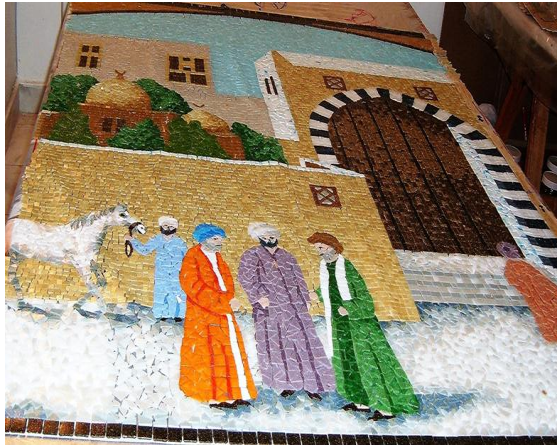
مراحل العمل (٧)