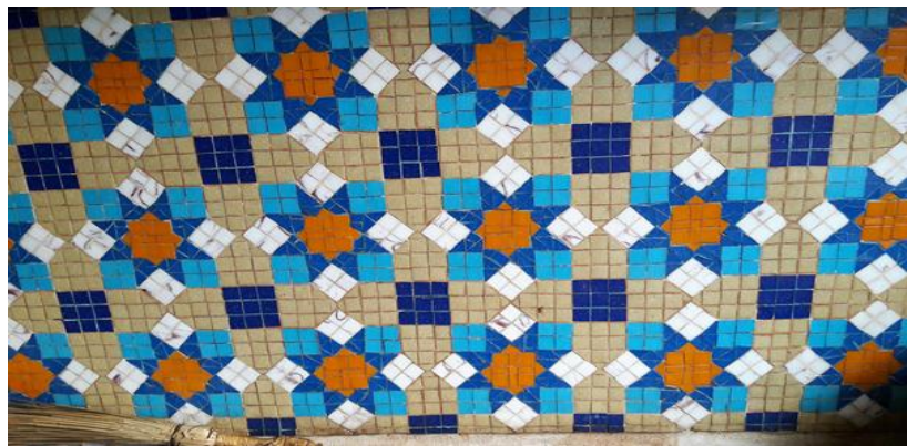
في الموقع (١٢)