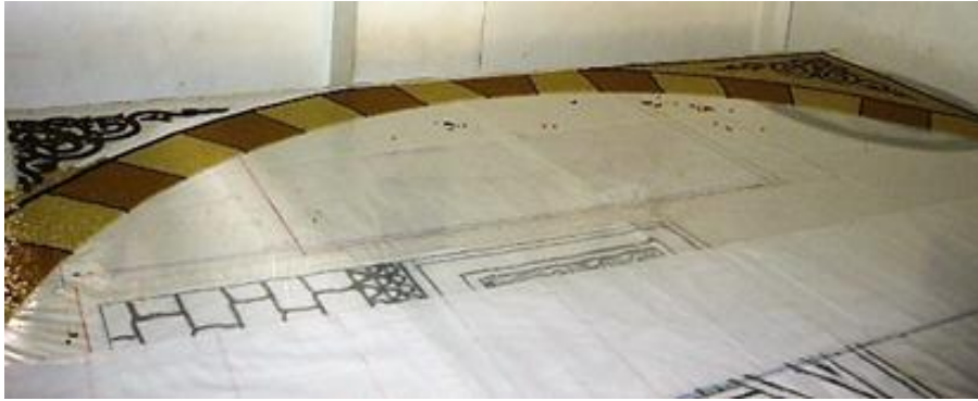
مراحل العمل في الرسم ( ١١ )