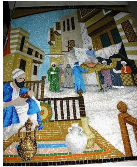
مراحل العمل (٣)