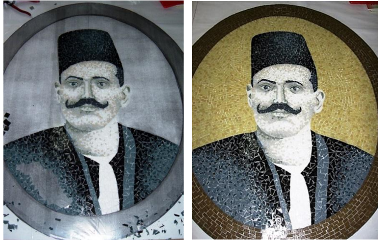
مراحل العمل في المرسم (٦)