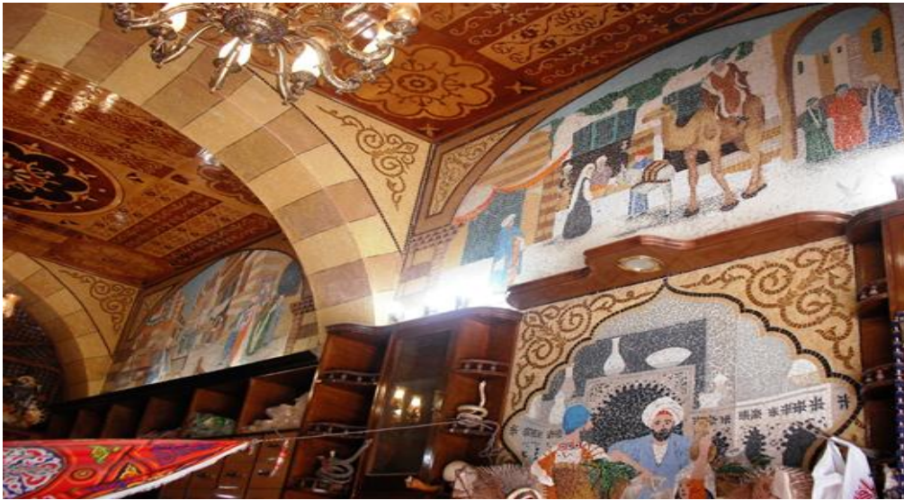
في الموقع عمل رقم (١) و(٢) و(٣)

الاهتمام الدائم بدرجات اللون البني واللون البيج سواء في الاطار الخارجي للعمل الفني الجداري او في المباني ذات تصميم مستوحاه من العمارة الإسلامية و التي نشعرنا بالأصالة والماضي الجميل ولكن لا ننسى وجود اللون البرتقالي في اكثر من اتجاه في التصميم ابتداء من ملابس الأشخاص ثم في السجادة المعلقة والسجادة الملقة علي الأرض بالجهة اليسرى و درجات اللون الأزرق التي نجدها في ملابس الأشخاص والسجادة وفي لون السماء وهما الوان مكمله معا وذو أهمية في إنجاح البناء التشكيلي في العمل الفني الجداري ، استخدمت الباحثة درجات الأبيض ودرجات الرصاصي ودرجة الأسود في الارضيات وفي بعض المباني والملابس أيضا التكرار لأحداث ترابط عام ما بين اللوحات الجدارية جميعها وتكرار استخدام لون الخلفية في كل اللوحات الجدارية تأكيد لاستمرارية الإحساس بعبير الماضي في انحاء المكان .