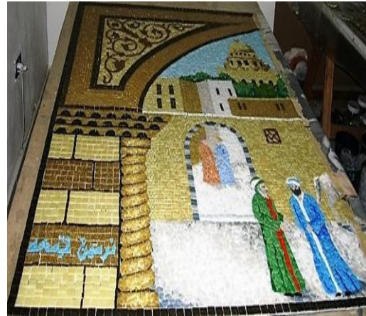
مراحل العمل (٧)