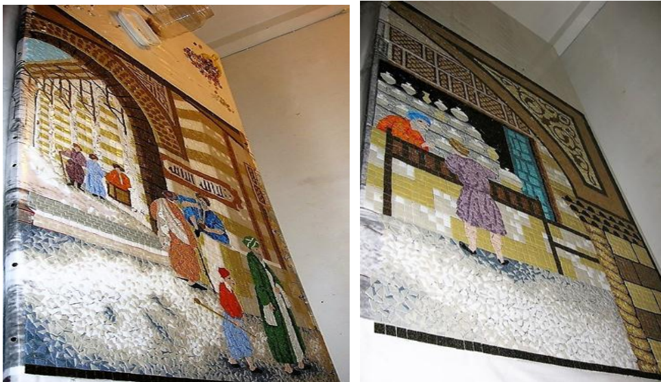
مراحل العمل في الرسم (٤)