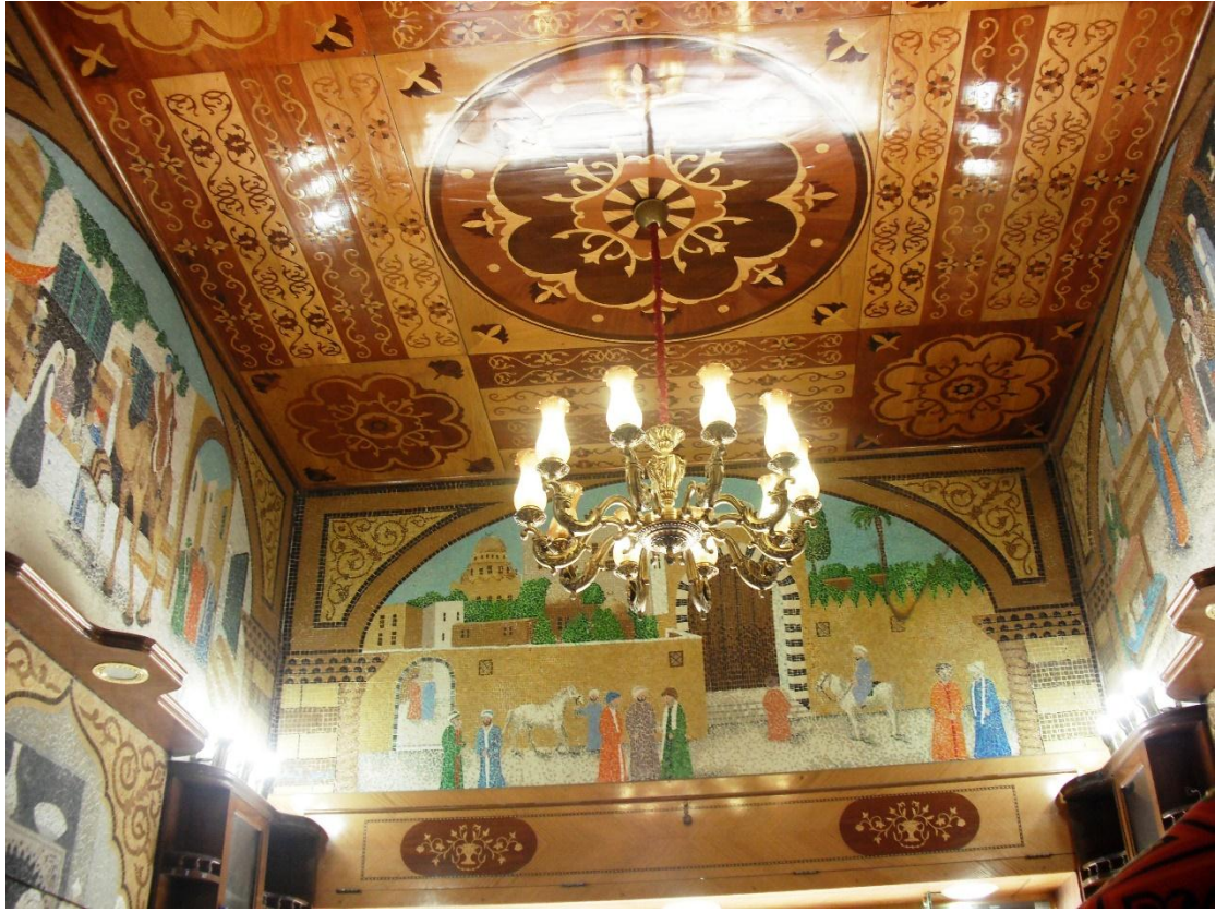
بعد الانتهاء من التركيب