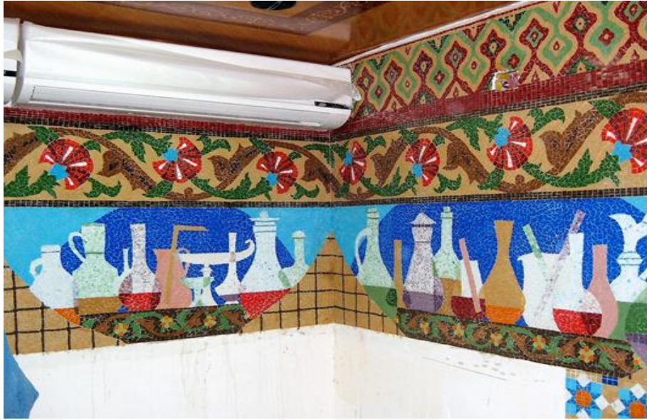
في الموقع (٩)