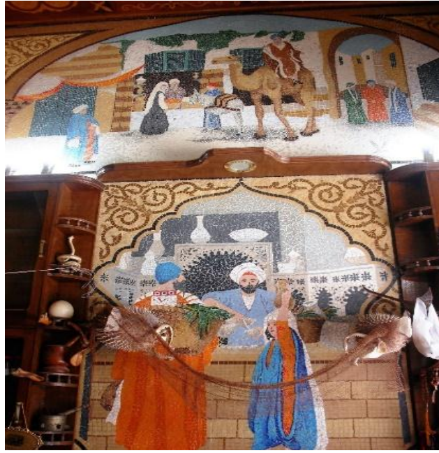
في الموقع عمل رقم (١) و (٢) معا