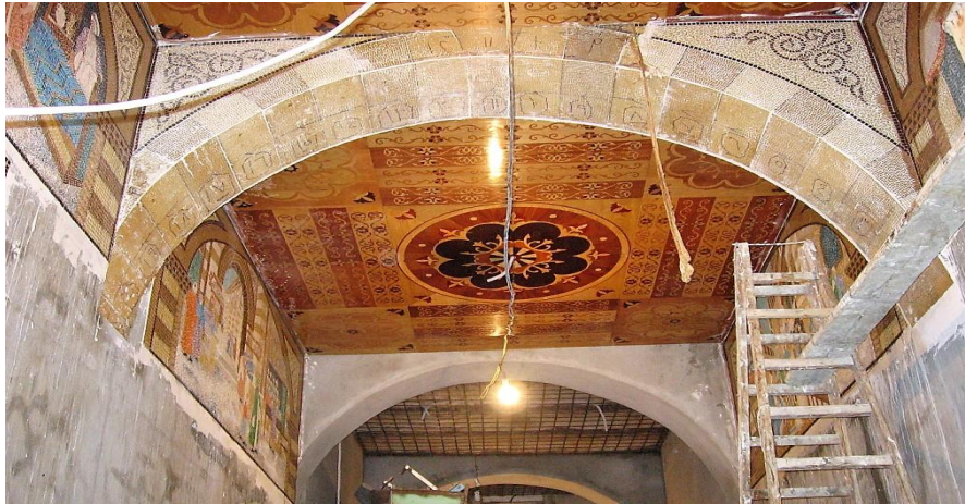
مراحل التركيب في الموقع ( ١١ )