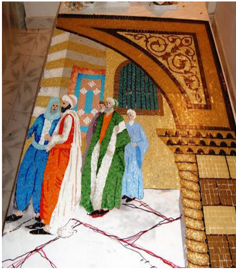
مراحل العمل (٣)