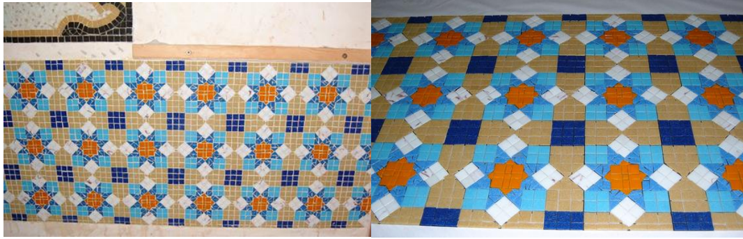
مراحل العمل في الرسم (١٢)