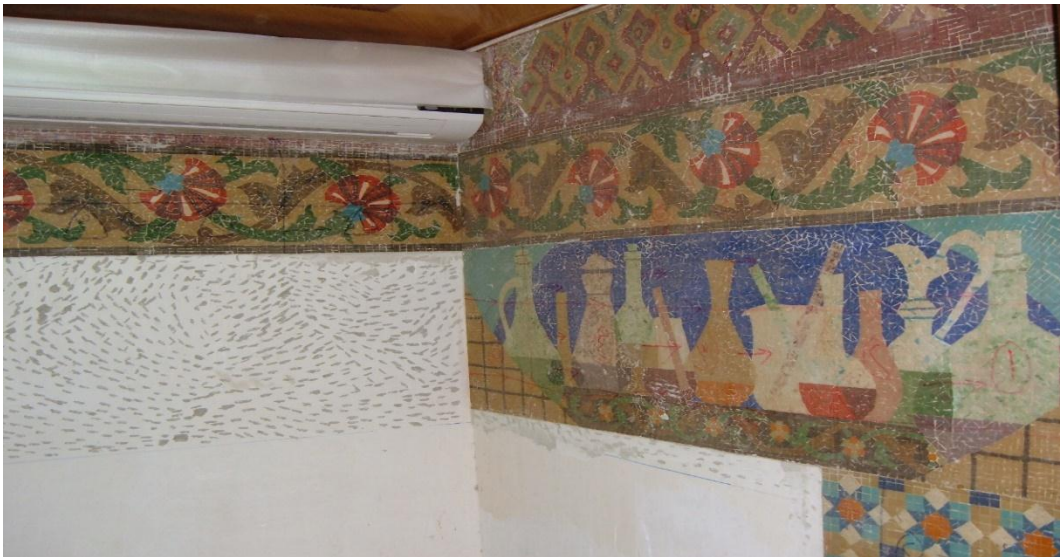
مراحل التركيب في الموقع (٩)