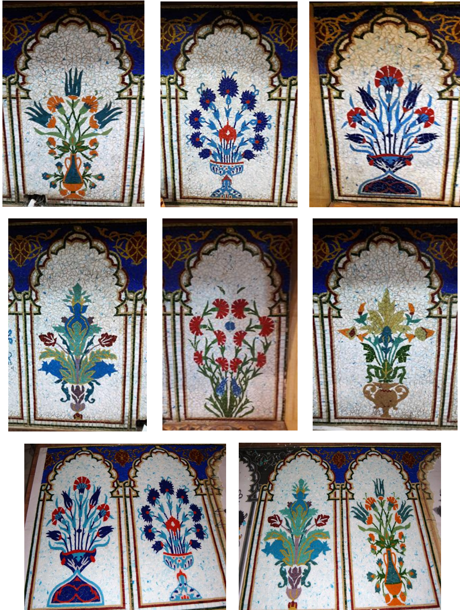
مراحل العمل في الرسم (٨)