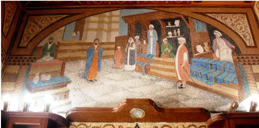
في الموقع (٥)