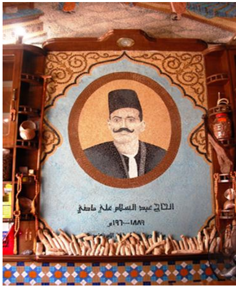
في الموقع عمل رقم (٦)