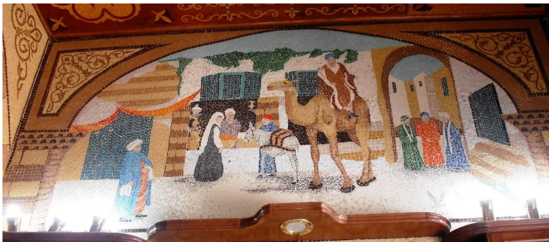
في الموقع (٢)