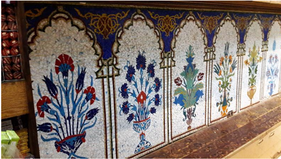
في الموقع (٨)