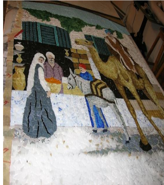
مراحل العمل (٢)