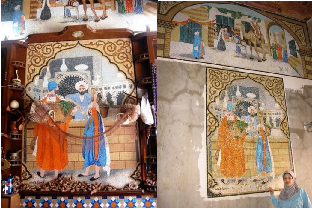
في الموقع (١)