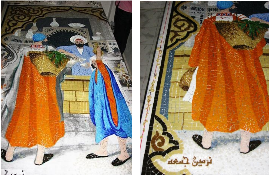
مراحل العمل في الرسم