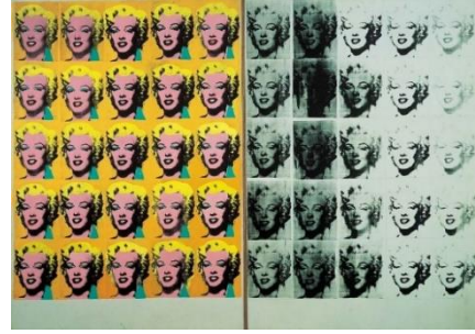
شكل (6) آندى وار هول، مارلين ديتش، 1962.

الفن تهينة نفسه واجتاحت الفاعليات الفنية العالم، وحقق فنانون من أمم وأعراف وثقافات عديدة نجاحات على المستويين التجارى والنقدي. "فظهرت توجهات كثيرة من قبل الفنانين داخل أمريكا نفسها وفى أوروبا، رافضة لفن العامة Pop Art على أساس أنه طراز فنى أمريكى، وبهذا لاقى هذا الاتجاه نوعاً من الجدل والنقد على أساس تعبيره عن الثقافات الرأسالية".