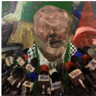
شكل (18) سيروان باران، وجوه بلا ملامح، 170×170 سم، 2018.

وهى من اللوحات الضخمة التى تبلغ مساحتها 420×520 سم. الصحن الفارغة والجثث المبعثرة التى تلتف حول بعضها تشبه لوحة العشاء الأخير، ولكن بصياغة مختلفة، استخدام اللون الزيتى الذى يعبر عن الزى العسكرى الذى أصبح جزءاً من تراث البلد، وتصوير اللوحة من منظور عين الطائر يجعلها أشبه بقطعة تفصيلية من نسيج الزى العسكرى تغزلها أجساد الشهداء فى شكل درامى صارم.