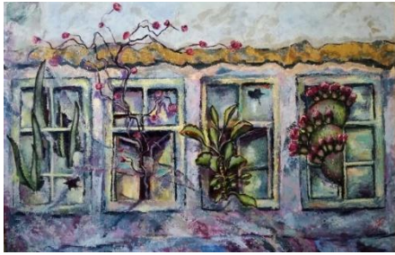
شكل (26)، من أعمال الباحثة: في كل بيت شهيد، 100سم × 150 سم، أكريليك على توال، 2018.

ويحميه؛ فبالرغم مما يناله الشهيد من مكانة في الجنة وعطف رباني على ما آساه، إلا أنه يترك خلفه الكثير من الحزن والألم لكل أفراد أسرته وأحبابه، وهذا ما تفعله الحرب بأبناء وطننا الحبيب؛ رسم الشهيد أعلى اللوحة تعظيماً لمكانته في الجنة، ويظهر في أسفل اللوحة على الجانب الأيسر شكل تجريدي لامرأة تجلس بجانبها طفل صغير، استخدم بها اللون الأزرق تعبيراً عن حالة الحزن، يقابلها خطوط حادة سوداء تعبيراً عن الأسلحة المستخدمة في الحرب، في الأرضية استخدم اللون البرتقالي الساخن تعبيراً عن حالة الغضب.