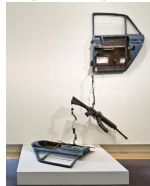
شكل (7) بيل وودرو، اثنان من أبواب السيارات الزرقاء، 1981.

اتجه الفنانون من الواقعية الجديدة إلى التجهيز فى الفراغ، والبحث عن الفكرة الأكثر جدلاً وتعبيراً عن مجريات الأحداث، فقاموا بمزج أنواع كثيرة من الفنون داخل العمل الفنى الواحد؛ مثل استخدام الموسيقى والفيديو والمؤثرات الصوتية، واستخدام العنصر البشرى كجزء من العمل الفنى، بجانب النحت والرسم والتصوير، ليصبح العمل الفنى فلسفة فى حد ذاته، يناقش قضايا مجتمعية بطريقة مغايرة عن الشكل التقليدي للعمل الفنى، وأصبح المعيار الجمالى للعمل الفنى هو الفكرة وكيفية توظيفها؛ وبعد بضعة سنوات نجح توجيه النظرة الفنية للجمال للفن المعاصر، واتجه الفنانون فى البداية إلى الفن المفاهيمي، ثم فن البيئة التى اعتمد على التداخل والاندماج مع الطبيعة من خلال استخدام مواردها فى صورتها الأولية مثل (النار- الحجر- الرياح..) داخل العمل الفنى، وأخيراً فن الأداء الذى أدخل الأداء الحركي والعنصر البشرى فى العمل الفنى.