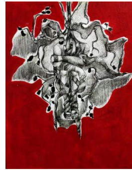
شكل (21)، من أعمال الباحثة: الشهيد 1، 25 سم × 35 سم، وسائط متعددة (حبر وأكريليك على ورق)، 2021.

أنتجت الباحثة (11) عملاً فنياً مستلهمة من موضوع الحرب وآثاره الناتجة عنه، وفيما يلي عرض لأعمال التجربة: