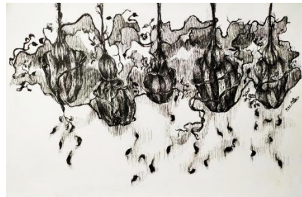
شكل (22)، من أعمال الباحثة: الشهيد 2، 25 سم × 35 سم، وسائط متعددة (حبر وأكريليك على ورق)، 2020.

يوضح العمل شهداء الوطن والجرحى والمصابين الذين يضحون بأرواحهم تجاه قضية يؤمنون بها، يتوسط العمل جسد رجل تملؤه الجروح ويجلس في وضع منكسر معلق من رأسه بأشرطة من الضمادات تغطي رأسه وتملاً أنحاء جسده، وتلتف حوله أفرع من النباتات في شكل ملائكي وكأنها ترفعه إلى السماء لتطيب جراحة وروحه المنكسرة، وأوراق تزهر في ترائف تشهد على بشرى تحقيق أحلام هؤلاء الشهداء، رسم تلك الجزء بالحبر الأسود ولونت أرضية العمل باللون الأحمر تعبيراً عن كثرة الدماء والضحايا التي تهدر في الحروب والثورات لتغير نظام.