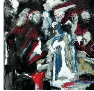
شكل (24) من أعمال الباحثة: الحرب 1، 16سم × 16سم، أكريليك على ورق، 2020.

من خلال معايشة الباحثة لأحداث ثورة 25 يناير، تلك الفترة الثورية التي غيرت من مجرى الأحداث السياسية لمصر، وما تلاها من أحداث كثيرة، كان الشعب هو من يدفع ثمن تلك التغييرات، فقدنا الكثير من الشهداء من الشباب والأطفال والنساء ورجال الشرطة والجيش، فقد نالت تلك الفترة فرداً من كل بيت مصري، وكانت دماء المصريين تملأ الشوارع وحدود البلاد، الآن حققنا التغيير، ولكننا لم ننس شهداء الوطن ممن دفعوا أرواحهم ثمناً لكى نحى حياة كريمة، رسمت أربعة شبابيك، يختلف كل شبابيك عن الآخر، هناك من فتح أبوابه وأرفف شبابيكه على مصراعيه، وشارك بالأحداث، ومنهم من تعرض لها بشكل غير مقصود ودون أن يشارك فعلياً، قد يكون خرج فى يوم لأداء عمله، لكنه تعرض للقصف الناري فى اشتباك بين الثوار والشرطة، وهناك من التزم الصمت وظل يشاهد المشهد عن بعد، لكن الموت نال منه أيضاً وأخذ منه شهيداً، نرى تأثير الطلقات النارية على كل الشبابيك التى تخرج منها أفرع الصبار بتنوع أشكالها، استخدم الصبار كتعبير عن الموتى أو المقابر، والذى يظهر بدوره الحزن داخل كل بيت، تظهر فى الجانب الأيسر من العمل بشفاافية، امرأة تجلس فى وضع ساكن وفى هدوء، ترمز إلى الأم والأخت والزوجة والابنة التى تفقد الأب أو الزوج بسبب الحرب.