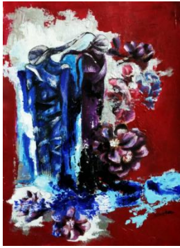
شكل (23)، من أعمال الباحثة: ما بعد الحرب، 25 سم × 35 سم، وسائط متعددة (حبر وأكريليك على ورق)، 2020.

يعتبر هذا العمل جزءاً ثانياً من العمل الأول "الشهيد1" يتكون العمل من خمسة مجسمات تعلق من رؤوسها في شكل يشبه الشرنقة تعبيراً عن انتقال الروح إلى العالم الآخر أو حياة جديدة، نسبةً لفكر القدماء المصريين عن الحياة والموت والبعث من جديد لحياة أخرى أبدية، تلتف حولهم غصون من الأشجار تزهر ببعض من الأوراق لتحافظ على تلك الشرنقة حتى يكتمل نمو أجساد من بداخلها ليبعث من جديد .. فالشهيد لا يموت تبقى ذكراه وأثره دائماً في قلوب الأحياء، تتكون تلك الشرائق من 5 أجساد مختلفة وكأنها ترمز للعائلة التي تضم الأب والأم والزوج والزوجة والطفل، فالحرب بدورها المرير تنال من كل الأعمار، حتى إنها من الممكن أن تنهى عائلات بأكملها نتاجاً لأعمال القصف الجوي الذي يقوم به المحتل تجاه المدنيين.