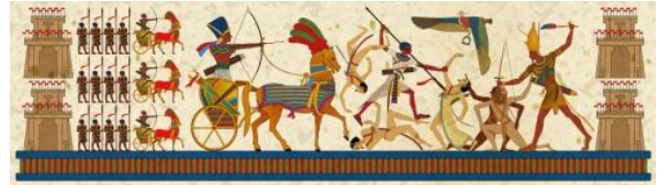
شكل (1) مشهد معركة أحمس ضد الهكسوس.

في العهود القديمة - ومع النزاع الدائم على الحياة - بدأت الحروب منذ بداية الخليقة، مع نزاع قابيل وهابيل - أبناء سيدنا آدم - الذى انتهى بقتل قابيل لأخيه هابيل، وتوالت بعد ذلك النزاعات والحروب بين القبائل، فقد كان الإنسان البدائي يقوم بتسجيل حياته ومعاركه باستخدام فن الرسم أو النقش على الحجارة، كطريقة لتسجيل حياته وانتصاراته، فارتبط الفن وطريقة التعبير عن الحياة الإنسانية بالحرب والمعارك كطريقة لتسجيل الانتصارات والتباهى بالقوة والسيطرة التى صنعت أقدم وأعظم حضارة شهدتها التاريخ، فظهرت من خلالها قوة وعظمة الإنسان المصرى القديم فى هزيمة أعدائه وتطور حكمه وسطوته على البلاد.