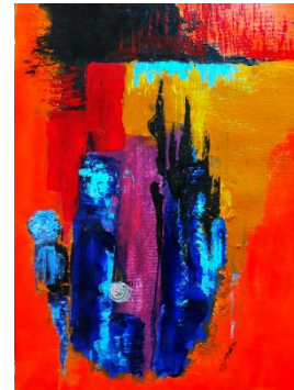
شكل (25)، من أعمال الباحثة: مراسم الوداع 1، 25سم × 35سم، أكريليك على ورق، 2020.

يوضح العمل حالة الحرب وقت حدوث المعركة وتبادل النيران وقصف جوى واشتباكات بين الجيوش وأفرادها من الجنود والضباط وسط كل هذا الدمار هناك هالة بيضاء تتوسط العمل، وكأنها أم تحمل رضيعها وتحاول الحفاظ عليه في حالة من السكون والهدوء، ليتوقف المشهد كاملاً وكأن الزمن يعطى لتلك المرأة وقتها للمرور في سلام، وقد يكون ذلك النور الساطع هو أمل السلام والسكينة التي يسعى له العالم دائماً، لكن الكثير من القادة والحكام يستخدمونه فرصة لإحداث الحرب فالسلام كذوبة استخدمها الآخرون للقضاء على بعض الدول أو السيطرة على العالم؛ حتى ينالوا لقب القوة العظمى؛ ليستطيعوا التحكم في العالم بأكمله، ويظل الأضعف تحت سلطته، فبالرغم من النزاعات الدائمة هناك أمل في الوصول إلى سلام دون حرب.