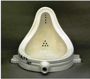
شكل (5) مارسيل دو شامب:

ذلك محاولات أن يعالج الفن الابتذالات اليومية، فمعد الانطباعية لم يتوقف الرسم عن تقديم توصيفات (غير جميلة) للواقع، في الرسم والنحت، حيث استخدم الفن فيما بعد الحربين العالميتين كفعل ثوريّ وتمرداً على معايير الجمال التقليدية، "تقدمت الفنون في ذلك الوقت وأصبح الفن وسيلة للتعبير عن الحياة الجارية، فالفن لا يخضع لقانون واحد إنما يخضع لظروف اجتماعية متعددة تجعله يتلون بشكل معين حسب الأشكال الاجتماعية، بدأت تلك التغييرات بظهور الدادائية عام 1916، ثم نشأت السريالية عام 1924، وأصبحت ظاهرة عالمية وذلك في أربعينيات القرن العشرين"، وظهر العديد من المدارس الفنية الأخرى، واستخدم الفن السياسي للتعبير عن متغيرات المجتمع، واعتبر تمثيل الجمال في ذلك الفترة ما هو إلا خداع وتمثيل لشيء غير موجود في الواقع؛ أدى ذلك إلى اختيار عناصر جاهزة باعتبارها أغراضاً فنية، بداية من عام 1913، ومن أشهرها (المبولة) وأطلق عليها اسم النافورة لمعرض جمعية الفنانين المستقلين بنيويورك في أبريل 1917، تم رفض هذا العمل من قبل لجنة اختيار اللوحات الفنية، ولكن ذلك لم يقلل من شهرة العمل، وتحولت نافورة دو شامب، من فن الصور الإنسانية إلى اللوحة التعبيرية.