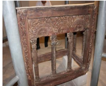
صورة 2 توضح

مذبحاً خشبياً قديماً موجود بداخل المتحف القبطي حالياً ، وهو مصنوع من خشب الصنوبر يرتكز علي أعمدة كورنثية ذات تيجان محورة و يعلو التيجان لوحات تحوي أصدافاً و صلبانا داخل عقود و نقشت في اللوحات زخارف نباتية وفيرة و طيور