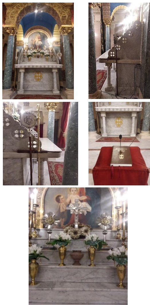
صورة (8) توضح مذبح بطريركية الأرمن الأرثوذكس من تصوير الباحث

توضح المذبح الرئيسي في كنيسة السيدة العذراء مريم السريان حيث من تصوير الباحث المذبح يعلو أرضية الهيكل بدرجة حوالي 10 سم يقف عليها الكاهن لأداء الطقوس و اللوتورية الخاصة بطقس القديس السرياني.