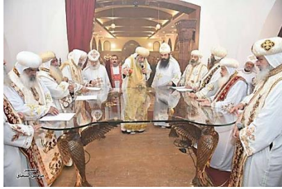
صورة (7) صورة توضح احد المذابح الزجاجية

هي مذابح حديثة العهد، مع التطور الذي نشهده في التكنولوجيا وإمكانية تحميل الزجاج بأحمال ضغط باستعمال الزجاج السيكرت، التريل جلاس، و قد زينت واجهاته الأربعة الشفافة بطيات نباتية و زخارف و صلبان و غيرها من إمكانية النقش علي الزجاج و الطباعة عليه للحصول علي التصميم المطلوب و النقوش المطلوبة و الزخارف القبطية مثل المذبح البحري لكنيسة الملك ميخائيل بمساكن شيراتون بمصر الجديدة فقد ارتكز المذبح علي أربعة قوائم تمثل أربعة ملائكة الكارويم يبسطون أجنحتهم و هي منحوتات خشبية و القرصة من الزجاج.