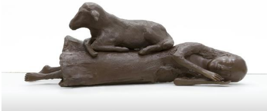
شكل(6) عمل للفنانة "كيكي سميث" اسم العمل: حمل فوق امرأة نائمة المجال: نحت الخامة: البرونز التاريخ: 2009م الأبعاد: (1.99.4.86.3.208سم) المكان: مركز روكفيلر بنيويورك

- يطرح العمل فكرة معرفة الذات وقبولها حتى وإن فرضت تصورات أقرب إلى البرية أو الوحشية، وهي فكرة تدعم قبول الآخر، وتقدم الهوية النسوية في احتجاجها على عدم المساواة والتفرقة الجنسية بين الرجل والمرأة.