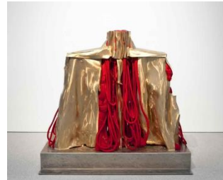
شكل (1) اسم الفنان: باربرا تشيس Barbara Chase اسم العمل: مالكولم إكس 1 عام 1969م الخامة: شرائح من البرونز وخيوط من الحرير والصوف والكتان العمل: منفذ على هيئة جذع إنسان وكان صدره في حالة نريف مستمر باستخدام الخيوط المعقودة والمضفرة والمصبوغة باللون الأحمر