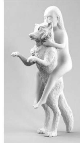
شكل(7) للفنانة: كيكى سميث اسم العمل: امرأة مع الذئب المجال: نحت الأبعاد: 12 x 20 x 37 سم التاريخ: 2003