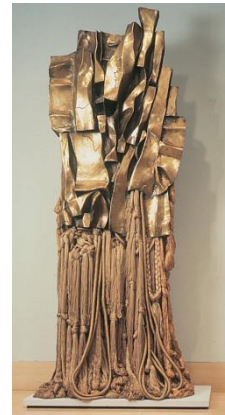
شكل (2) اسم الفنان: باربرا تشيس Barbara Chase اسم العمل: مالكولم إكس 3 المقاس: 25x120x300 سم الخامة: شرائح من البرونز وخيوط من الحرير والصوف والكتان عام 1970م