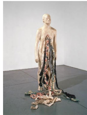
شكل(8) عمل للفنانة كيكى سميث Kiki Smith المجال: نحت إسم العمل: بدون عنوان الخامة: بودي فورم من البولي استر مع غلاف جلدي من اللدائن، وبعض الأقمشة والجلود المختلفة والورق التاريخ: 1992م