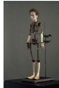
شكل (5) نموذج آخر للفنانة: إليزابيث كنج من نفس المعرض