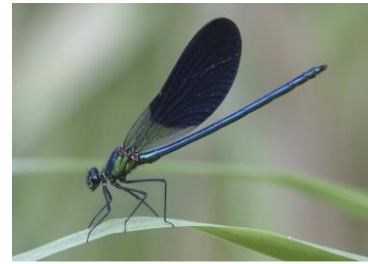
( شكل 1 ) لذكر حشرة اليعسوب يظهر بها الجسم

الأنثى : منطقة البطن أكثر سمكاً ولها زائدة لوضع البيض عن نهاية البطن.