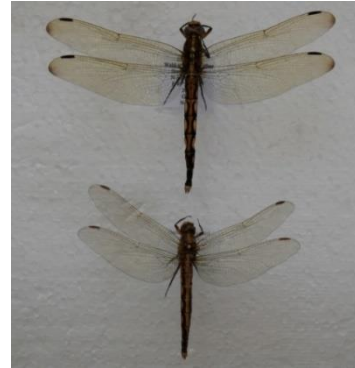
( شكل 2 ) لأنثى حشرة اليعسوب يظهر بها