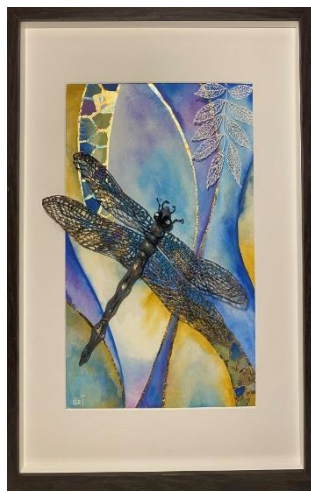
التصنيف: تصميم ( لوحة زخرفية )