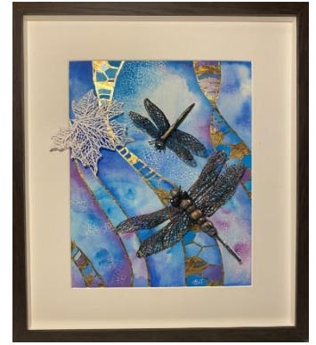
التصنيف: تصميم ( لوحة زخرفية )