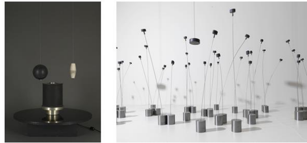
شكل 12 أ - تاكيس- الحقل المغناطيسي - متحف التيت جاليري للفن الحديث - لندن - 1969 . شكل 12 ب - تاكيس - الباليه المغناطيسي - متحف التيت جاليري للفن الحديث - نيويورك -1961. (٦)

وابتكاراً ومرحاً فيما يتعلق بالطاقة ، ومن بين أهم مساهماته المنحوتات التي سماها ( الإشارات Signals ) المستوحاة من إشارات السكك الحديدية وغالباً ما تركزت على عرض الأضواء الساطعة ، والمنحوتات المغناطيسية عن بعد التي بدأت في نهاية الخمسينيات وعرضت لأول مرة في Galerie Iris Clert في باريس ، وتتكون من أجسام معدنية ذات أشكال هندسية كروية أو أسطوانية معلقة في الفضاء بواسطة مغناطيس ، ففي عام 1964 كان عمله مصدراً لاسم المعرض الراديكالي Signals London؛ ويبحث هذا المعرض عن جمال الكون الكهرومغناطيسي الذي اكتشفه ، فكان مهتماً بجعل المشاهد يدرك تأثيرات القوى غير المرئية التي تحرك العالم من خلال تكويناته الفنية التي اعتمد في صياغتها على تأثير الطاقة المغناطيسية على الحركة والتغير، ويبدو واضحاً من ذلك مدى التحول في الأسلوب الفني للنحات لطرح موضوعات تتعلق بمضامين فكرية تعكس مفاهيم جمالية مرتبطة بنظريات علمية في محاولة لإيجاد معادلاً بصرياً للتعبير عن أفكار مجردة .