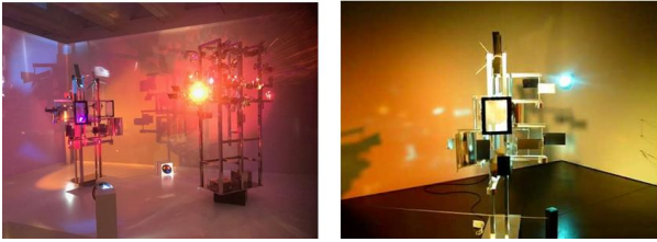
شكل 11 أ ، ب - نيكولاس شوfer - مجموعة كرونوس رقم 5 ( إسم أبو زيوس كبير الآلهة في الأساطير اليونانية القديمة ) - ستانلس ستيل - مصدر ضوء وصوت وحركة - المجر- 1960 .

السينمائي حيث يقوم بتصميمها وتركيبها والتي تعتمد علي شرائح إلكترونية دقيقة والتي ينتج عنها تشكيلات متغيرة ومتنوعة بخلق بيئة جمالية تؤثر علي المدركات الحسية والعقلية للمشاهد من خلال الجمع بين العناصر المادية المكونة لبيئة العمل في إطار المكان والزمان اللذان يحددان طبيعة الحركة وتأثير نظامها علي المشاهد ، فطبيعة تلك الأعمال تطرح نظاماً تشكيمياً يجمع بين الوسائط المادية والأسطح الضوئية والفراغ الذي تتغير ألوانه بطريقة مستمرة من خلال انعكاس الشرائح الملونة من أجهزة العرض .،