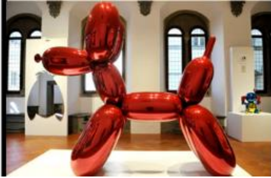
شكل 3- أ - يزورالسائحون تمثال كلب البالون على السطح في الهواء الطلق على قمة متحف متروبوليتان للفنون ، مدينة نيويورك ، الولايات المتحدة الأمريكية . (13)

ويشتهر Koons على نطاق واسع بمنحوتاته الشهيرة "Rabbit" و "Balloon Dog" وتمثل تلك النوعية من الأعمال مواضيع الثقافة الشعبية وإعادة إنتاج أشياء مصنوعة إعتيادية ، مثل دمي حيوانات البالون البلاستيكية وتقديمها كأعمال نحتية ضخمة الحجم مصنوعة من الفولاذ المقاوم للصدأ ذات أسطح مصقولة كالمرآة تشبه البالون المضغوط بالهواء . 12 بالإضافة إلى منحوتاته الزهرية الضخمة مثل ( Puppy-1992 - الجرو ) المعرض في ساحة متحف جوجنهايم والمثبت بشكل دائم في Guggenheim Bilbao وكذلك المسماة ( Split-Rocker2000 - إنشقاق الصخر ) ، وقد تم تركيبها سابقاً في القصر البابوي في أفينون ، وقصر فرساي ، ومؤسسة بلير في بازل ، وتم عرضها مؤخراً في مركز روكفلر Rockefeller عام 2014 م .