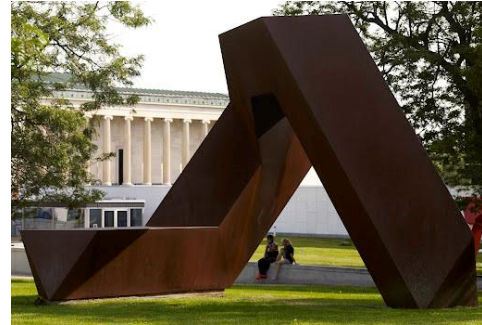
شكل 9أ، ب - توني سميث - سيجارة - Cigarette - فولاذ مطلي - ارتفاع 15 قدماً - حديقة البيت الأبيض - أمريكا - 1961 (22)