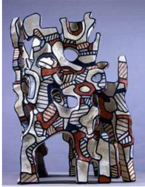
شكل - 7 أ ، ب - مجموعة الأشجار الأربعة - هيكل معدني - إي بوكسي - 40 قدم ارتفاع - نيويورك - أمريكا - 1974 .

ومن خلال ذلك يتضح التحول في المنظور الفكري للنحات الذي بات منشغلاً بقضايا خارج نطاق ذاته وأصبح الاهتمام بموضوعات مبعثها البحث في جوهر العلاقة بين الفن والحياة في صورتها الحقيقية بطريقة موضوعية كعملية بحثية في النفس البشرية وعلاقتها بالعالم الخارجي .