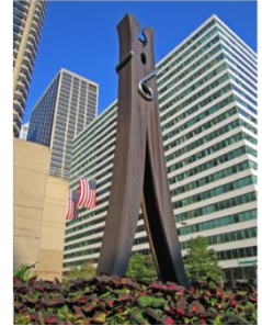
شكل 1- كلايس أولدنبورغ - مشبك الغسيل : يبلغ ارتفاعها 15 مترًا في وسط مدينة فيلادلفيا 1976 م (الولايات المتحدة الأمريكية) مقابل قاعة المدينة . (9) شكل 2- كلايس أولدنبورغ - جسر الملعقة والكرزة (1985 - 88) - الألومنيوم والفولاذ المقاوم للصدأ والطلاءحديقة مينابوليس - مينيسوتا - شيكاغو - أمريكا (10)

وكذلك تكوينه النحتي في عام 1962، حيث صادفته رؤية ملعقة ملقاة على كومة من الشوكولاتة الصناعية المزيفة واستقر المشهد في ذهنه وظهرت الملعقة في عدد من تخطيطاته ورسوماته التحضيرية لسنوات ، واستغرق أكثر من عقدين قبل أن تتحقق الفكرة - كمنحوتة ضخمة - في حديقة مينابوليس . في الثمانينيات من القرن الماضي ، عندما كلفه - مركز ووكر للفنون - بإنشاء منحوتة نافورة . وأشارت عليه زوجته " بروجن " - كشرية له في المشروع - بأن الملعقة تناسب المكان ، وكانت مساهمتها عبارة عن شكل الكرز الموضوعة على طرف الملعقة العلوي بلونها الأرجواني الداكن يميز إضافتها المرحلة إلى ممارسة أولدنبورغ الفنية للمشروع حيث أعاد تخيل منتزه رصيف نيفي بيبير في شيكاغو على أنه ملعقة عملاقة .