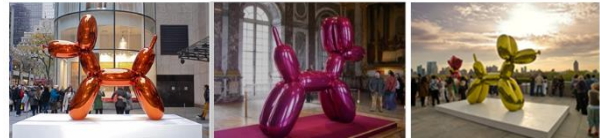
شكل 3- ب ، ج ، د ، هـ - جيف كونز Jeff Koons ، كلب البالون ( اللون - ماجنتا ) 1994- فولاذ مصقول ومطلي -2000م

واحد من خمسة إصدارات فريدة (أزرق ، أرجواني ، برتقالي ، أحمر ، أصفر). مصنوعة من الفولاذ المقاوم للصدأ المصقول المرآة مع طلاء ملون شفاف ، تم بيع النسخة البرتقالية في عام 2013 بسعر قياسي لنحات لازال على قيد الحياة . (14)