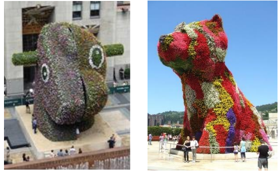
شكل - 4 -

واحد من خمسة إصدارات فريدة (أزرق ، أرجواني ، برتقالي ، أحمر ، أصفر). مصنوعة من الفولاذ المقاوم للصدأ المصقول المرآة مع طلاء ملون شفاف ، تم بيع النسخة البرتقالية في عام 2013 بسعر قياسي لنحات لازال على قيد الحياة . (14)