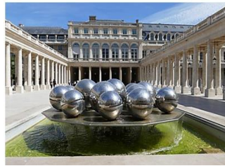
شكل 10 - بول بيوري - تكوين نافورة - أشكال كروية - ستانلس ستيل - ساحة مجلس الأمة - باريس - 1985 - شكل 10ب - بول بيوري - تكوين نافورة - أشكال أسطوانية - ستانلس ستيل - 1971 .

الأعمال النحتية خاصة بأساليب فنية وطرق تقنية غير تقليدية تجسد طبيعة التغيرات الفكرية في العصر الحالي . ويجسد العمل النحتي المسمى ( سيجارة ) لتوني سميث أحد الأعمال البيئية وهو عبارة عن قطعة بسيطة من النحت ذات هيكل مجوف ومصنوع من مستويات مسطحة من الفولاذ ذات أسطح ملتوية وهي واحدة من سلسلة من ثلاثة هياكل متشابهة ، ومقام على أرض معرض Albright Knox للفنون في بوفالو ، نيويورك . هي البيئي تم إنشاؤه عام 1961. يبلغ ارتفاع التكوين أكثر من 15 قدماً.