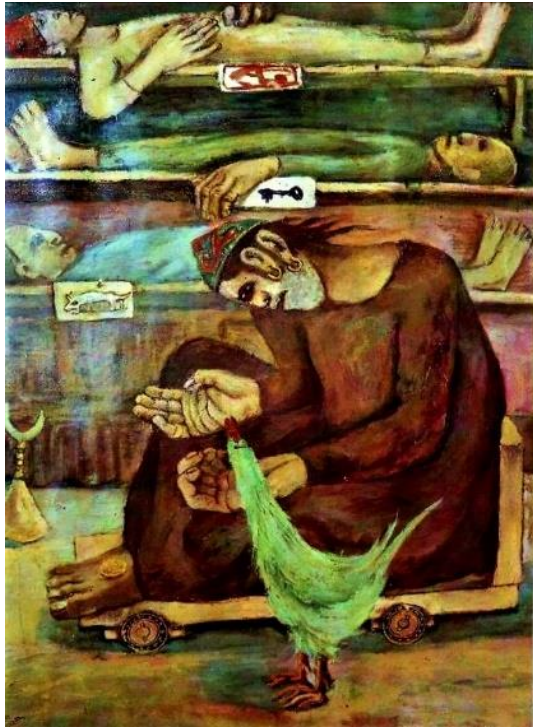
عبد الهادي الجزار_ودن من طين وودن من عجين_ رسم زيت _ 110x70_ 1951_ متحف ميتروبوليتان في نيويورك (14)

إستلهم الجزار من الحكم والأمثال الشعبية الساخرة والساخطة وترجمها الى مردود بصرى، فأصبحت بعناصر التشكيل أقوالاً حية وأمثالاً مصورة. عبر الجزار في لوحة (ودن من طين وودن من عجين) عن مجموعة من الفقراء والشحاذين، فعندما وصل الفنان