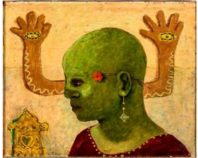
عبد الهادي الجزار- المجنون الاخضر- زيت على كرتون _١٩٥١سم_٣٧×٦٣_مجموعة نجيب ساويرس

لقد أتجه الجزار منذ بداية الحركة الفنية الحديثة إلى التعبير عن الموروثات العقائدية الشعبية فصور واقع الحياة المصرية الشعبية بما تحمله فى طياتها من معتقدات وتقاليد وعبادات وأساطير ورؤى غيبية، كما كان من أهم أعضاء جماعة الفن المعاصر، التى قام بتأسيسها حسين يوسف أمين فى عام 1946. فتبنت السعى لأنشاء فن مصرى معاصر يتفاعل مع التيارات الفنية الحديثة بما فيها التعبيرية والسريالية، ولكن بطابع مصرى له ملامح التراث المحلى بما فيه (عالم الأساطير والخرافات الشعبية المصرية ورموزها السحرية ذات الدلالات التراثية والحياتية، التى عانت من ضيق العيش والكساد الذي تعرض له البلاد بعد الحرب الثانية، فكشفت أعمال الجزار عن الطبقة المطحونة بواقعها المرزى، ضياع تلك الطبقات فى ممارسة الشعوذة والخرافة ومن أهمهم عبد الهادي الجزار.