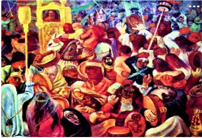
عبد الهادي الجزار_ المولد _ زيت على كرتون_ 62x62_ 1955_