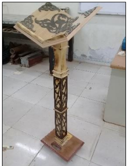
اسم الطالب: موسى الدعجاني مقاس العمل: 110سم "ارتفاع" 40سم "عرض" 40سم "سمك"