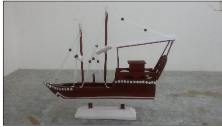
اسم الطالب: علاء حسين زين بحاري مقاس العمل: 400سم عرض × 40سم ارتفاع × 8سم سمك