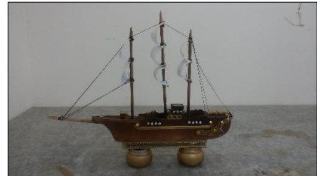
اسم الطالب: ربيع علي الاعجم مقاس العمل: 400سم عرض × 40سم ارتفاع × 8سم سمك