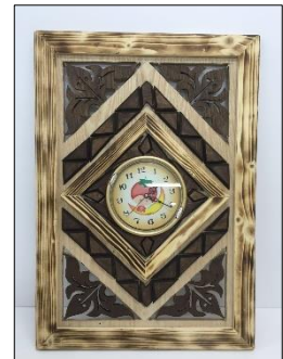
اسم الطالب: حسن الحكمي مقاس العمل: 60سم "ارتفاع" 40سم "عرض" 3سم "سمك"