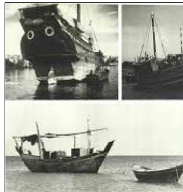
محفوظات القرية التراثية بمنطقة جازان - وزارة السياحة - المملكة العربية السعودية