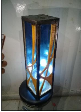
اسم الطالب: وائل علي معجري مقاس العمل: 60سم "ارتفاع" 20سم "عرض" 20سم "سمك"