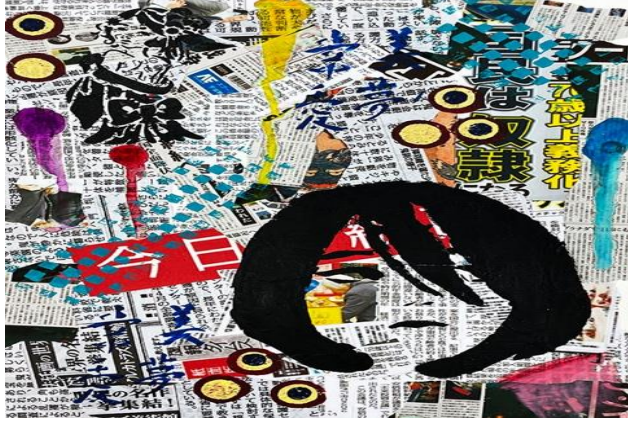
شكل رقم (3) من أعمال الطالبات

القصاصات اليابانية لكي تغطي بها أرضية العمل لإعطاء هوية متكاملة مع العناصر المختارة من شخصيات لفتاة يابانية هي بطلت احد أفلام الرسوم المتحركة اليابانية، وربطتها مع بعض الكلمات والرموز اليابانية التي اثرت العمل .