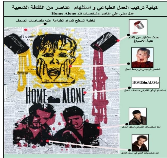
شكل رقم (2) من أعمال الطالبات

اختارت طالبة أخرى شخصية واختارت ان تعبر عنها بنفسها من غير ان تربطها مع شخصية بفيلم محدد، في الشكل (٥) اختارت احدى الطالبات الفنانة الراحلة سعاد حسني، فمن خلال جلسات