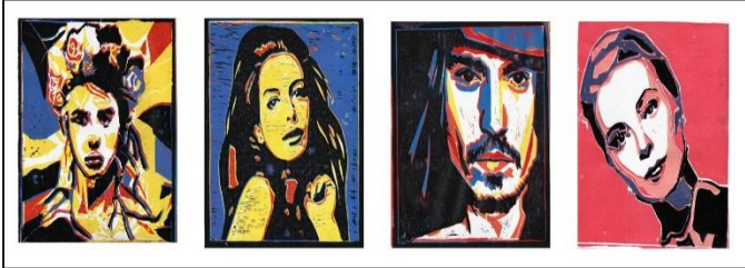
شكل رقم (1) من أعمال الطالبات

وكما ذكر الباحث في السابق ان على الطالبات تطبيق من ٣ الى ٤ ألوان كطبقات لإظهار تفاصيل وملامح العمل، كما يتضح في الشكل رقم (1)، بعض نتائج المشروع الأول في هذه الدراسة وتعتبر جميع النتائج الى حد ما ناجحة، علما بأن الطالبات لم يسبق لهم التعامل مع الخامة قبل هذه التجربة.