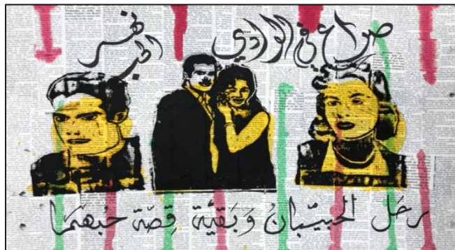
شكل رقم (4) من أعمال الطالبات

عمل آخر تأثرت في شخصياته احدى الطالبات، كما في الشكل (٤)، وهو الفلم المصري "صراع في الوادي" والذي تم انتاجه سنة ١٩٥٤، وعبر الطالبة فيه عن مدى اعجابها في شخصيات الفيلم الرئيسية، الفنان عمر الشريف و فاتن حمامة، استخدمت في العمل بعض العبارات الكتابية مثل "نهر الحب" و "رجل الحبيبان وبقيت قصة حبهما"، وتعمدت الطالبة تجسيد الشخصيتين مرتبطين ببعضهما في منتصف اللوحة و مفصولين عن بعضهما بأطراف اللوحة في الاتجاهين، تعبيراً وتماشياً مع السياق الدرامي في الفيلم.