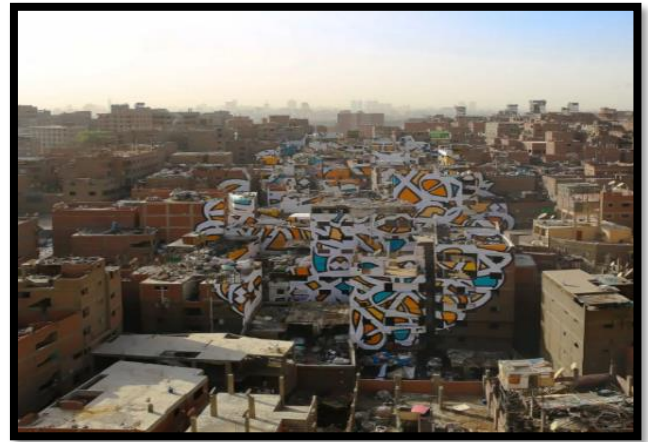
شكل رقم (4) : ال سيد ، جرافيتي ، القاهرة ، 2016م. (/https://www.instagram.com/p/CbluD_DP9Sq)

وقد يكون ال سيد من أشهر فنانين الجرافيتي المستخدمين الخط العربي في العالم حيث ترك رسومات الخط العربي على الكثير من مباني العالم وكون له أسلوب خاص في هذا الاتجاه، واستلهمت رسومات الجرافيتي الخاصة بال سيد من أزمة الهوية التي عاشها في فرنسا كمواطن فرنسي مع أبوين تونسيين كما يقول: في فرنسا يجعلونك تشعر وكأنك لا يمكن أن تكون سوى فرنسي، لكن في حالتني وجهي لا يبدو فرنسيًا، واسمي لا يبدو فرنسيًا هذا ما دفعني إلى تعلم اللغة العربية ، والعودة إلى جذوري ، وظهر الأسلوب الخاص للفنان في فن الخط العربي بعد انتقاله إلى أمريكا الشمالية في عام 2006، وتهدف لوحات السيد للجرافيتي إلى مواجهة الكليشيهات المحيطة بالعرب والمسلمين في فرنسا وخارجها وإن استخدامه للغة العربية استجابة لعلامة الثقافة الغربية التي أغلقت تعبيرات الاختلاف بشكل فعال ، وعمل السيد في سياقات متنوعة في جميع أنحاء العالم. (Kleppinger & Reeck , 2018)