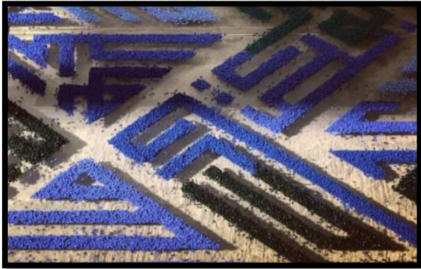
شكل رقم (1) فرح بهبهاني، (رحال)، تجهيز في الفراغ، معرض رحلة الكتابة والخط عبر التاريخ، الرياض، 2021م

( https://www.picuki.com/media/2249543149813233710 )