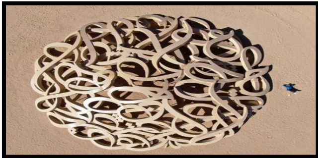
شكل رقم (6): ال سيد، جرافيتي ، العلا ، 2020م. (/https://www.instagram.com/p/B7_clx6JTn9)

وأكد ال سيد من خلال عمله الفني على العلاقة بين فن الأرض والفكر والعودة للموروث الثقافي، " حيث يركز الاتجاه الفكري لفن الأرض على رغبة الفنان في أن يعيد الوحدة الضائعة بين الطبيعة والفكر وبين العقل والكون". (حماد، 2005، ص 189)