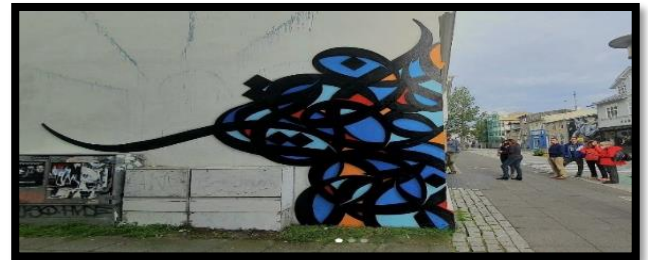
شكل رقم (5) :ال سيد، جرافيتي ، ايسلندا ، 2021م. (/https://www.instagram.com/p/CSw13kOtnqr)