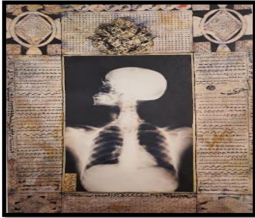
شكل رقم (3): احمد ماطر، (إضاءات)، وسائط متعددة على ورق، 2008م. (AMIRSADEGHI, MIKDADI, و SHABOUT, 2009)

التكنولوجي الحديث، وبذلك فان الفن المفاهيمي يمثل مرحلة من النشاط ما بين الفكرة والانتاج النهائي. (عمران، 2016) و"يرتكز الاتجاه الفكري للفن المفاهيمي حول (الفكرة)، أو المفهوم فهي أهم جوانب العمل الفني أكثر أهمية من المنتج الشكلي". (حماد، 2005، ص189) وفي الاتجاه المفاهيمي طرح الفنان أحمد ماطر مجموعة (إضاءات) حيث وظف الفنان في مركز العمل صورة الأشعة السينية، وأضاف حول الأشعة على ورق مقهر رسومات وكتابات لآيات قرآنية وبعض الحروف العربية وزخارف كالموجودة في المخطوطات الإسلامية. استفاد أحمد ماطر من الخط العربي ليؤكد على خلفيته الثقافية العربية والدينية، واستعار صفات المخطوطة العربية ليعيد قراءة قصة طفولته "حيث يظل الخط شكل من أشكال الفن يمكن ممارسته خارج المخطوطة". (BLOOM & BLAIR, 2019)