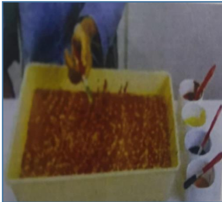
ثالثاً : اضافة اكثر من لون شكل ( 3 )