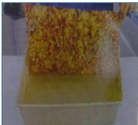
سادساً : التصميم النهائي(32) شكل ( 6 )