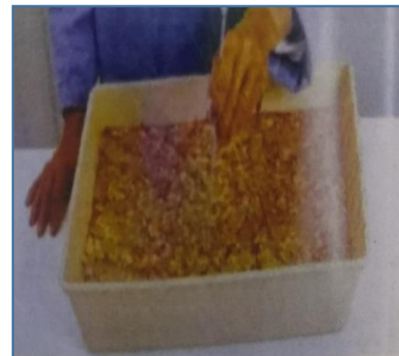
رابعا : تحريك الالوان بأدوات الترقيم شكل ( 4 )