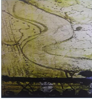
صورة رقم 5) الفنان انطوني تابيس (Antoni tapies) - تجهيز السطح بالعجائن اللونية الاكربليكية البيضاء السميكة وتطبيق فوقها بتقنية الفروتاج