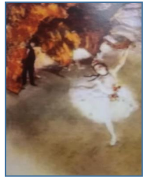
صورة رقم (8)

ادجار ديجا (Edgar degas) صور (8 , 9) لوحات فنية استخدم فيها الفنان تقنيات فن المونوتيب الحذف والاضافة http://www.google. Com /search? صور ( 8 , 9 ) عن موقع