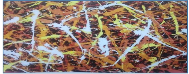
صورة رقم ( 1 )

الفنان جاكسون Jackson pollock : يعتبر الفنان جاكسون بولوك هو رائد الفن الحركي ومن أهم الفنانين الذين يمثلون الإتجاه التعبيري التجريدي ( 1912 – 1956 ) ولقد تأثر بأساليب الفنانين التأثيريين التي إمتازت بالحركة الألية والإعتماد على الصدفة والتعبير عن إحساسات تشكيلية ملموسة تجسد انفعالات الفنان بشكل مباشر (ويتمثل أسلوب تلوين الفنان بولوك Pollock في عملية قذف الألوان السائلة على قماش اللوحة من خلال علب مثقوبة من قاعدتها مارا على اللوحة الممدودة على الأرض من جميع زواياها بطريقة آلية شبة دائرية أو بوضعية مرتبطة بالحركة الفيزيائية لليد، منتج علاقات خطية متشابكة ومتنوعة بكثافات وتناغمات مختلفة وكأنها من عمل الصدفة) كما بالصورة رقم ( 1 )