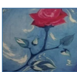
صورة ( 12 )