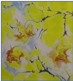
صورة ( 13 )