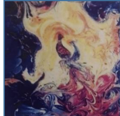
صورة ( 12 )