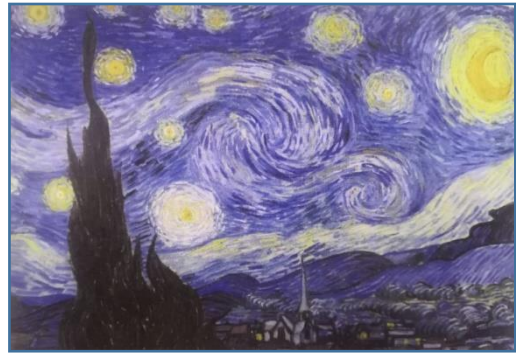
صورة رقم (3)

تميزت أعمال فان جوخ الأولى التي رسمها في هولندا كما في صورة رقم (3) بألوان قاتمة وأشكال ثقيلة، بدأ تقليد المدرسة الهولندية وظهرت في أعماله سمات تعبيرية واضحة كانت تعكس رغبته في استخدام الفن كوسيه للاتصال بالفقراء ثم تلي ذلك مرحلة تغير فيها أسلوبه الفني وبدأ يهتم بالضوء وابتكر أسلوبه المميز الذي استخدم فيه فرجون في لمسات بارزة مميزة بخطوط قوية كما حدد أشكاله بخطوط داكنة استمد فكرتها من المطبوعات اليابانية إلا أن بها طاقة انفعالية تعبيرية واضحة، واتسمت أعماله بالهدوء والرزانة (21)