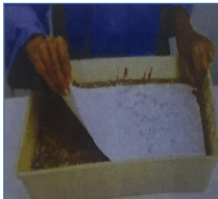
خامساً: وضع ورقم لسحب التصميم شكل ( 5 )