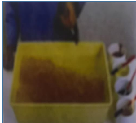
ثانياً : وضع اللون في الحوض شكل ( 2 )