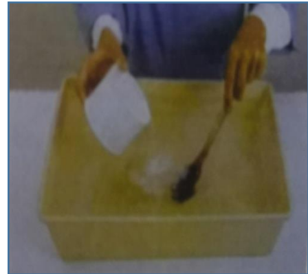
اولاً: وضع المتخن على الماء شكل ( 1 )